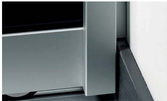
Überbrückung der Sockelleiste mit der Griffleiste von Profil I Bridging element at plinth with handle strip from Profile I