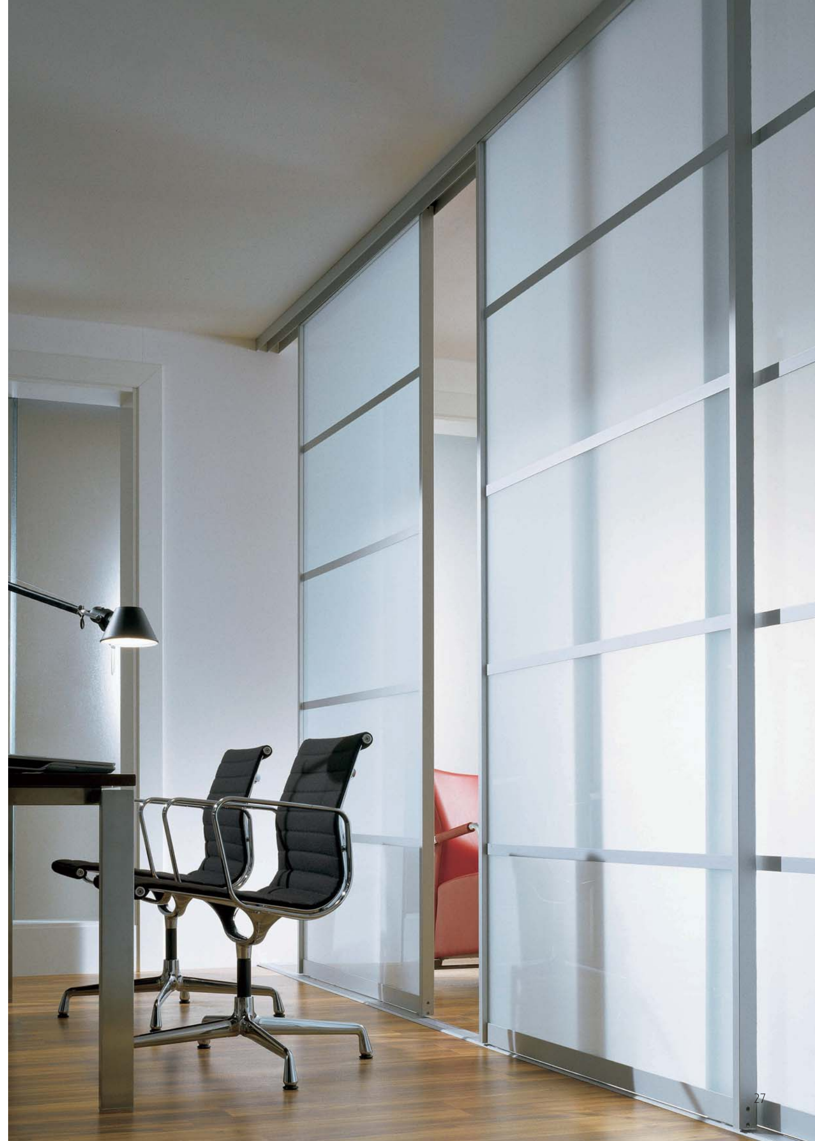
Below left: SINUS Profile I, anodised aluminium, panel: Safety glass with light-matt film, runner technology: floor track, two-way, fitted.