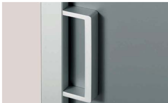
Bügelgriff am Profil I Bow handle on profile I