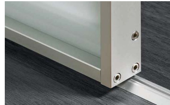
Profil S-Linie, Alu eloxiert Profile S range, anodised aluminium