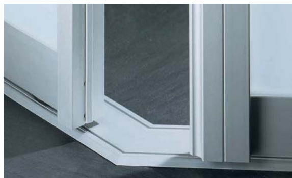
Ecklösung 45°, Aluminium eloxiert 45 ° corner solution, aluminium anodised