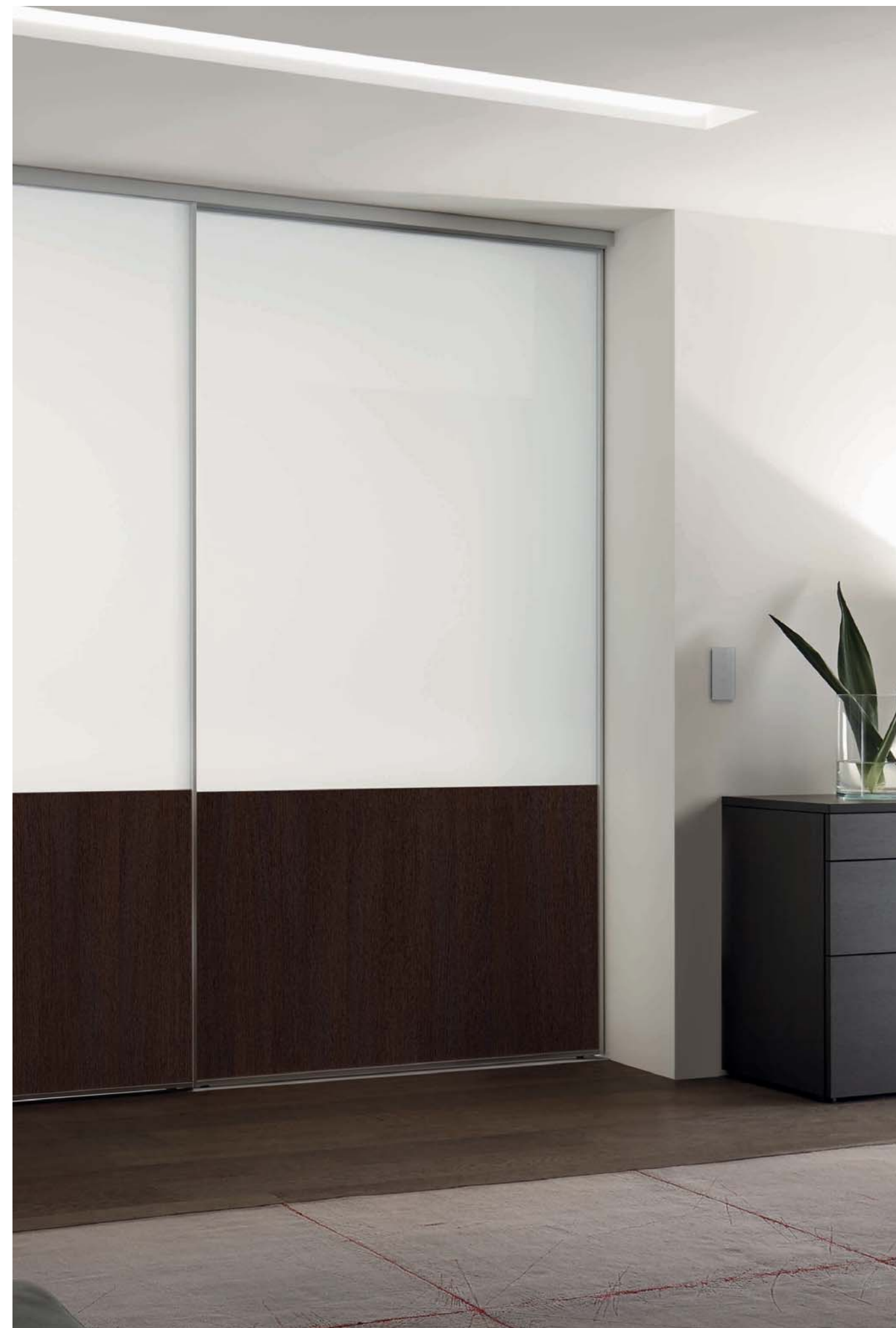
Left: SINUS S range, “L” and “R” door, safety-glass panel with light-matt film and sandy beige finish. Runner technology: floor track, two-way, fitted. Right: SINUS S line, “U” door, safety-glass panel with light-matt film and dark walnut finish. Runner technology: floor track, two-way, fitted.