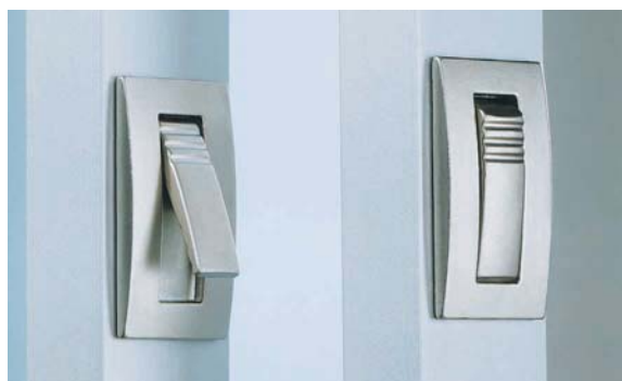
Klappgriff Flip-up handle