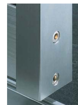
Edelstahl Stainless steel (möglich bei Profil I+II) (available for profiles I and II)