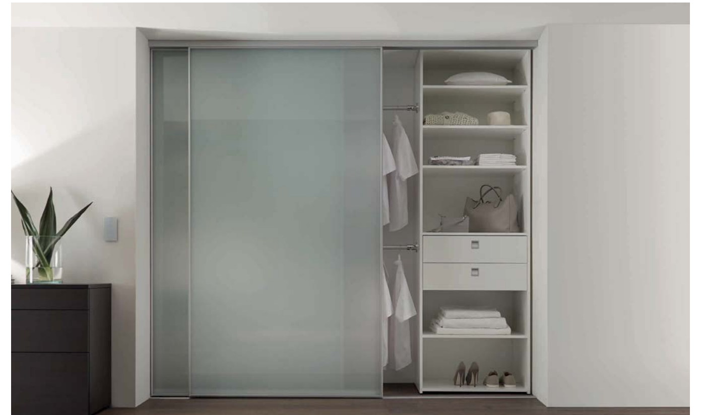
SINUS S-Linie, Füllung VSG mit hellmatter Folie. Lauftechnik: Aufgesetzte Bodenschiene, 2-läufig. SINUS S range, safety glass with light-matt film. Runner technology: floor track, two-way, fitted.