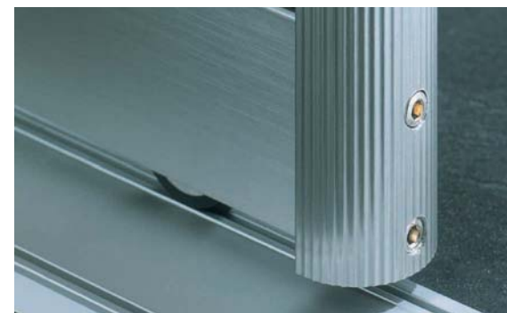
Profil II, Edelstahloptik Profile II in stainless steel look