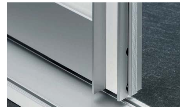
Profil III, Alu eloxiert, hier mit weiß glänzender Einlage Profile III, anodised aluminium, shown here with white gloss inlay