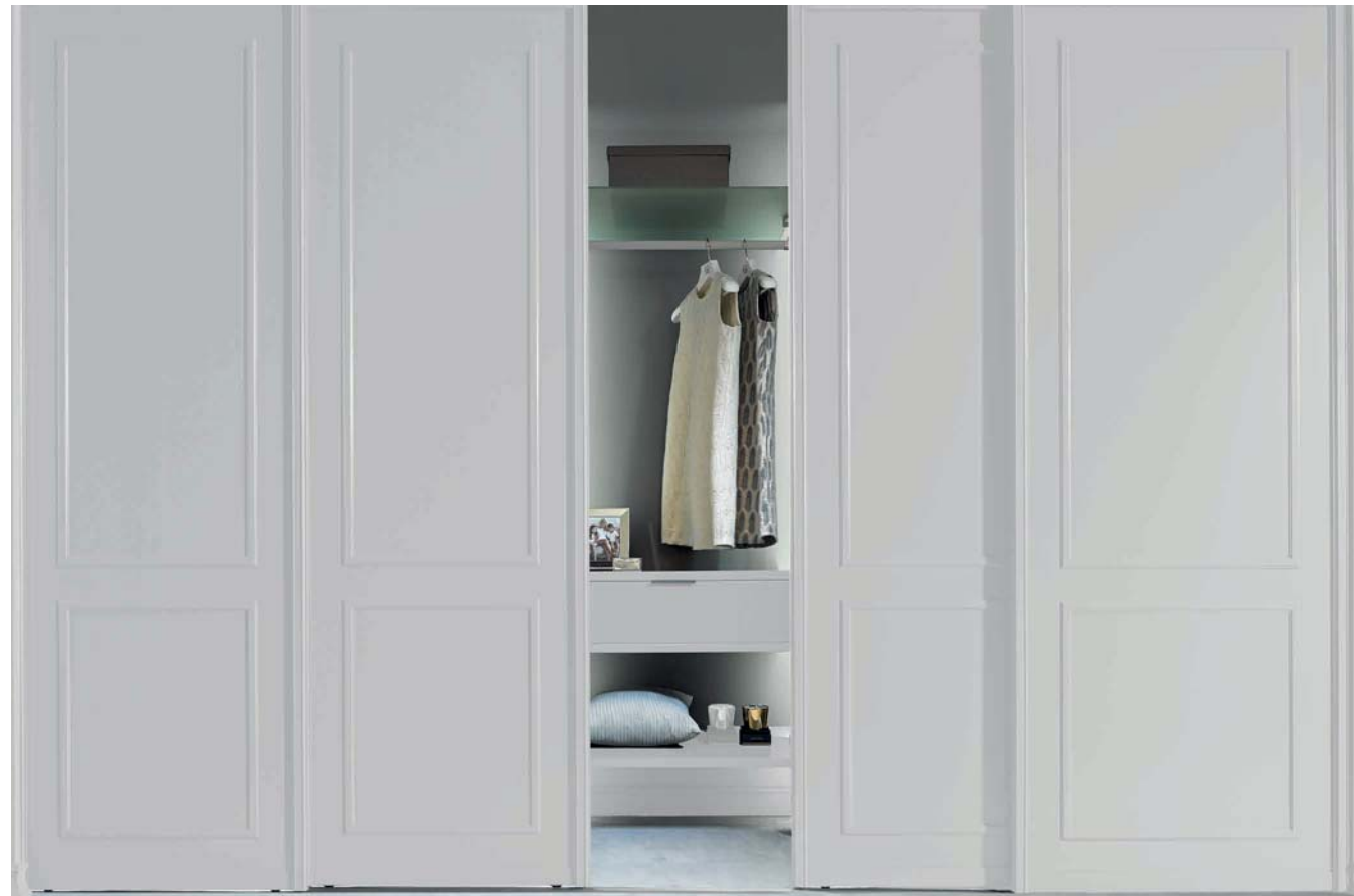
SINUS Profil IV, Alu reinweiß seidenmatt lackiert, Füllung: Reinweiß seidenmatt lackierte Oberfläche mit Aufleistung (verschiedene Aufleistungsvarianten möglich). Lauftechnik: Aufgesetzte Bodenschiene, 2-läufig