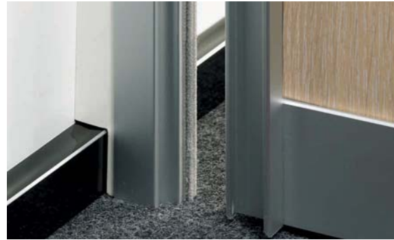
Wandanschluss zum Ausgleich nicht lotrechter Wände Wall end to balance non-perpendicular walls