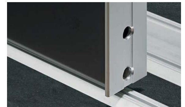
Profil V, vollflächige Glastür mit dezentem Alurahmen Profile V, full-face glass door with unobtrusive aluminium frame

SINUS hält 6 unterschiedliche Profil-Varianten bereit und zusätzlich noch eine vollflächige Schiebetür ohne Profil (siehe Seite 16-19). Standardmäßig werden die Türen in Alu eloxiert gefertigt. Es stehen aber optional noch drei weitere Oberflächen für Sie zur Wahl: