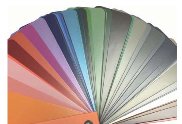
Lacktöne nach RAL, NCS oder Sikkens mischen wir gerne auf Wunsch an. We are happy to mix shades corresponding to RAL, NCS or Sikkens upon request.