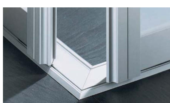
Ecklösung 90°, Aluminium eloxiert 90 ° corner solution, aluminium anodised