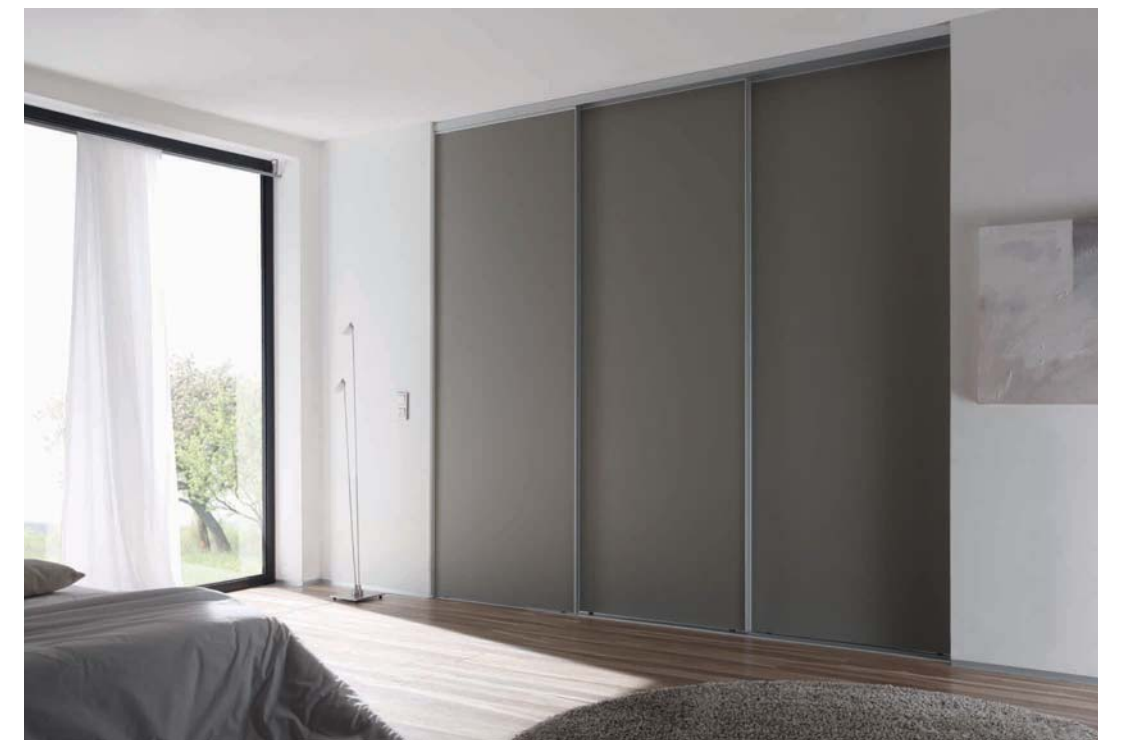
Links: SINUS vollflächige Tür in Lacobel schwarz mit dezentem Alurahmen (Profil V).

Lauftechnik: Aufgesetzte Bodenschiene, 1-läufig.