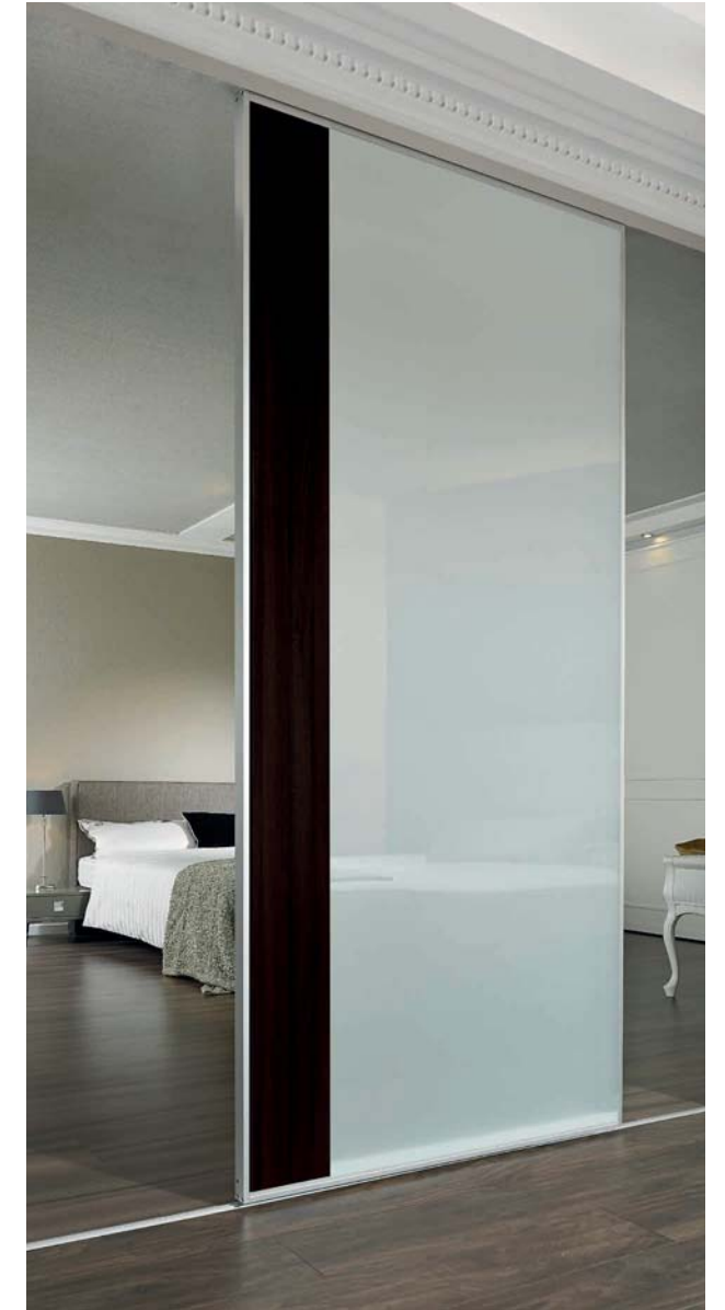
S-Linie, Türform „L“, Füllung: VSG mit hellmatter Folie und Eiche dunkel SINUS S range, „L“ door, panel: safety-glass with light-matt film and dark oak finish.