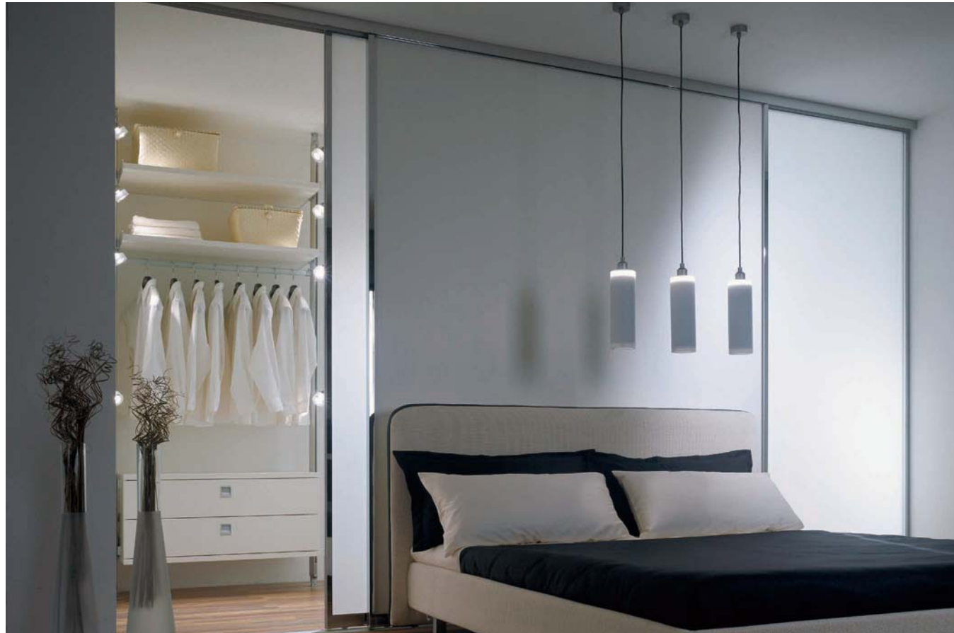
SINUS Profil I, glänzend verchromt, Füllung: VSG mit hellmatter Folie. Lauftechnik: Aufgesetzte Bodenschiene, 2-läufig. Sinus profile I, high-gloss, chrome-plated, panel: Safety glass with light-matt film Runner technology: floor track, two-way, fitted.