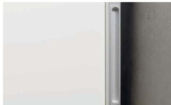
Griffmulde in Profil I Recess handle in profile I