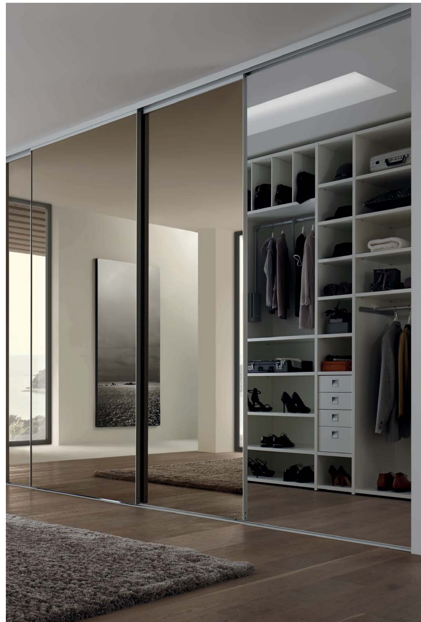
Left: SINUS full-face door with bronze-tinted Parsol glass and unobtrusive aluminium frame (profile V). Runner technology: floor track, two-way, fitted. Right: An open SINUS sliding door offers a glimpse into the LOGO cabinet.