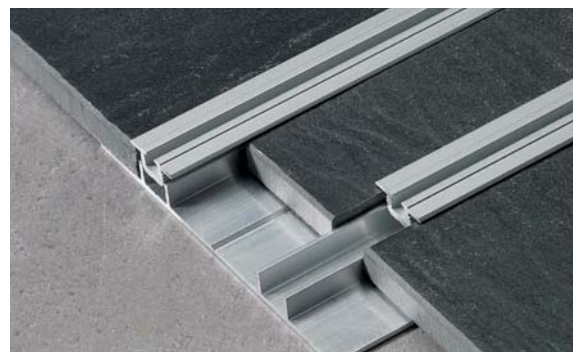
Bodenschiene eingelassen mit Aufnahmeprofil, 2-läufig Inset floor track with retainer profile, two-way