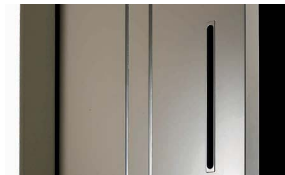
Griffmulde farbig lackiert in vollflächiger Schiebetür Flip-up recess handle with colour finish in full-face sliding door