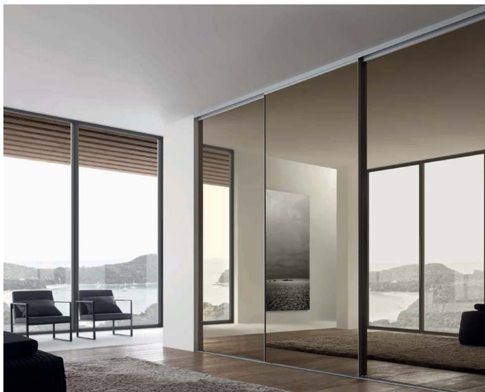
Links: SINUS vollflächige Tür mit bronzefarbigem Parsolspiegel und dezentem Alurahmen (Profil V). Lauftechnik: Aufgesetzte Bodenschiene, 2-läufig. Rechts: Gibt die geöffnete SINUS Schiebetür einen kleinen Blick auf den dahinterliegenden LOGO-Korpus frei.