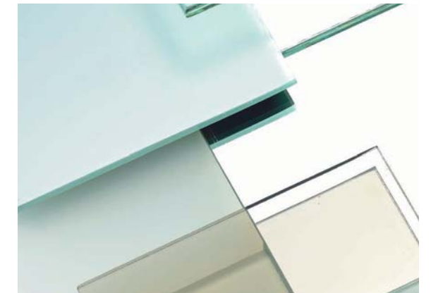
Gläser und Spiegel Glass and mirror