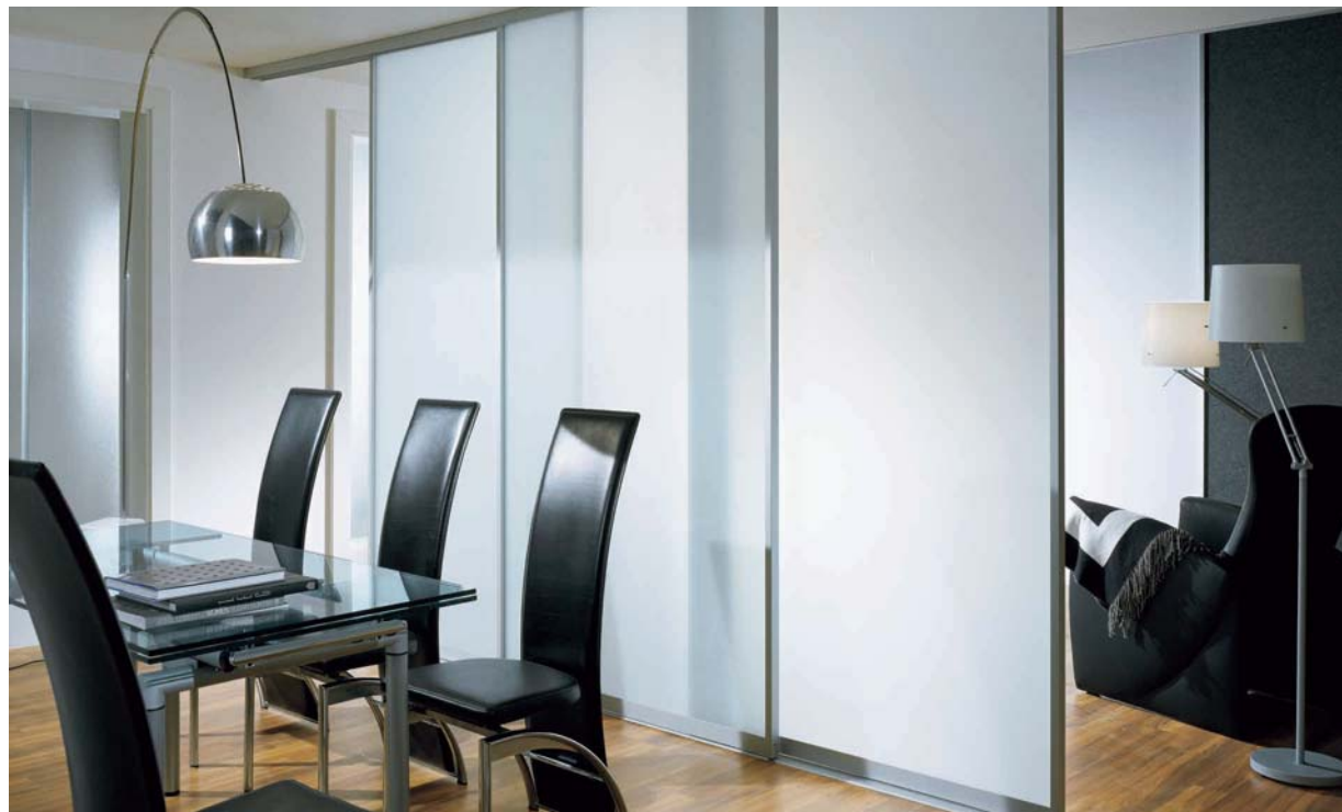
Links oben und rechts: SINUS Profil I, Alu eloxiert, Füllung: VSG mit hellmatter Folie, Dekorleisten zur optischen Füllungsteilung. Lauftechnik: Aufgesetzte Bodenschiene, 2-läufig.