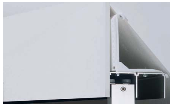
Verblendeter Deckenanschluss für Dachschräge nach hinten Veneered ceiling end for roof slope facing to the back