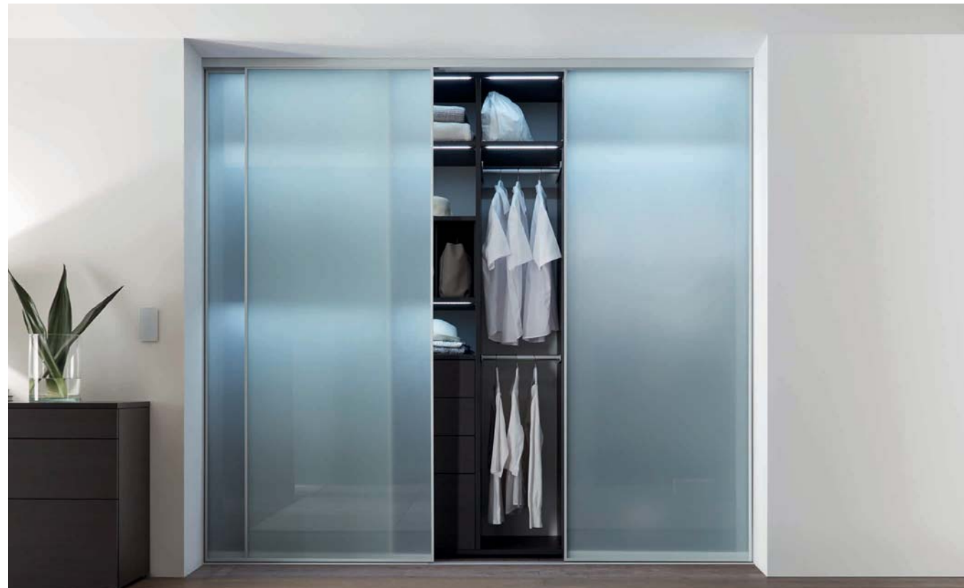
SINUS S-Linie, Füllung VSG mit hellmatter Folie. Lauftechnik: Aufgesetzte Bodenschiene, 2-läufig. SINUS S range, safety glass with light-matt film. Runner technology: floor track, two-way, fitted.