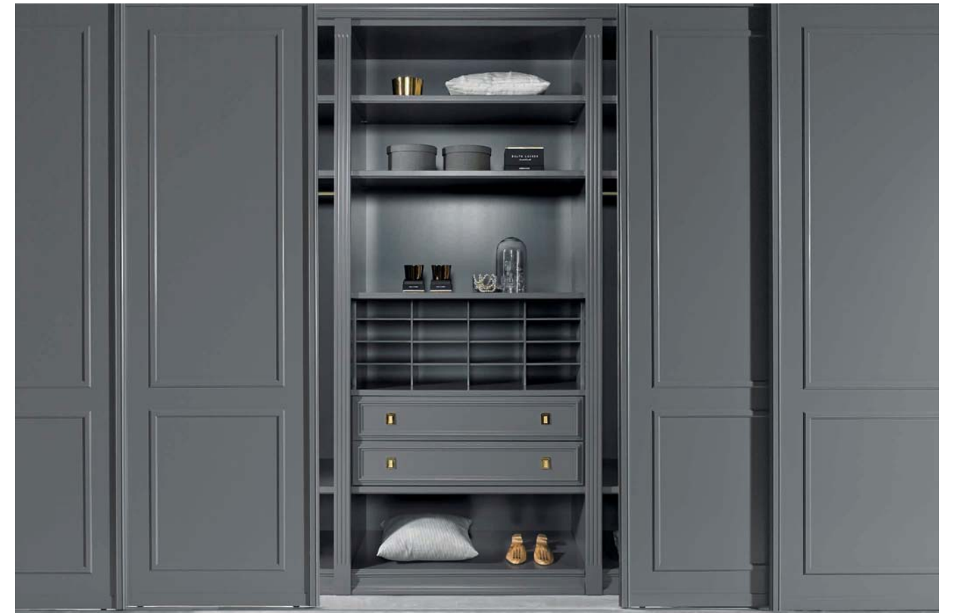
SINUS Profil IV, Alu nachtgrau seidenmatt lackiert, Füllung: Nachtgrau seidenmatt lackierte Oberfläche mit Aufleistung (verschiedene Aufleistungsvarianten möglich). Lauftechnik: Aufgesetzte Bodenschiene, 2-läufig