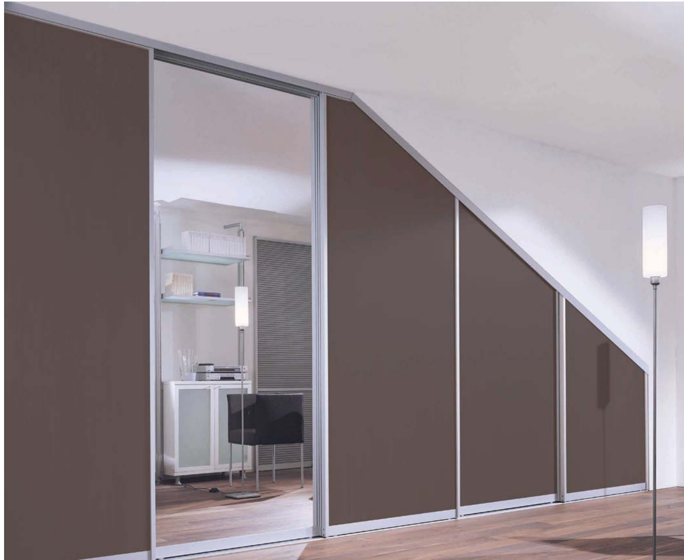
SINUS Profil I, Alu eloxiert, Füllung: Orientbraun lackierte Oberfläche und Kristallspiegel. Lauftechnik: Aufgesetzte Bodenschiene, 2-läufig.

SINUS Profile I, anodised aluminium, panel: Oriental brown finish and crystal mirrors Runner technology: floor track, two-way, fitted.