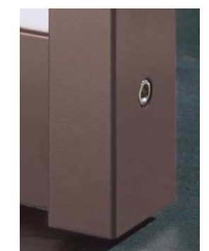
Lack in beliebiger Farbe The colour of your choice