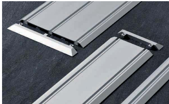
Bodenschiene aufgesetzt, 1-, 2- und 3-läufig Floor track fitted, one, two and three-way