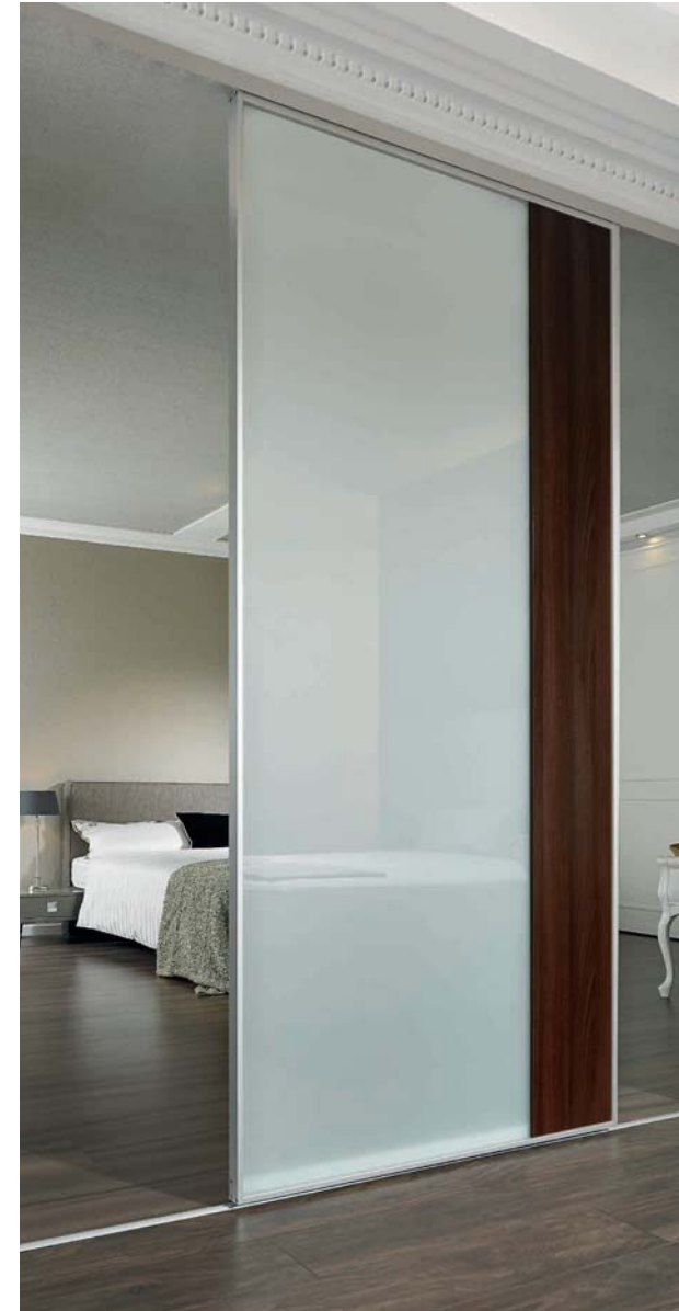
S-Linie, Türform „R“, Füllung: VSG mit hellmatter Folie und Nussbaum dunkel SINUS S range, „R“ door, panel: safety-glass with light-matt film and dark walnut finish.