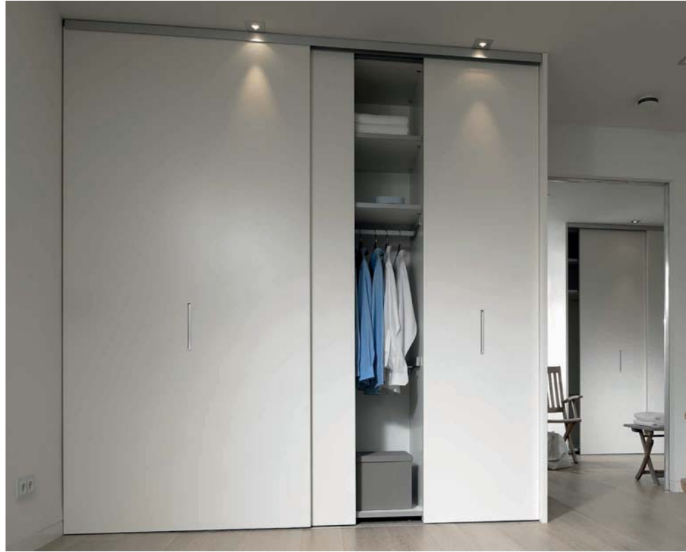
Links: SINUS vollflächige Tür, ohne Profil. Ausführung in Lack uni seidenmatt reinweiß, Griffmulden eingelassen, Alu eloxiert. Lauftechnik: Eingelassene Bodenschiene, 2-läufig. Rechts: SINUS vollflächige Tür, ohne Profil. Ausführung in Lack uni seidenmatt reinweiß, Griffmulden eingelassen, Alu eloxiert. Lauftechnik: Aufgesetzte Bodenschiene, 1-läufig.