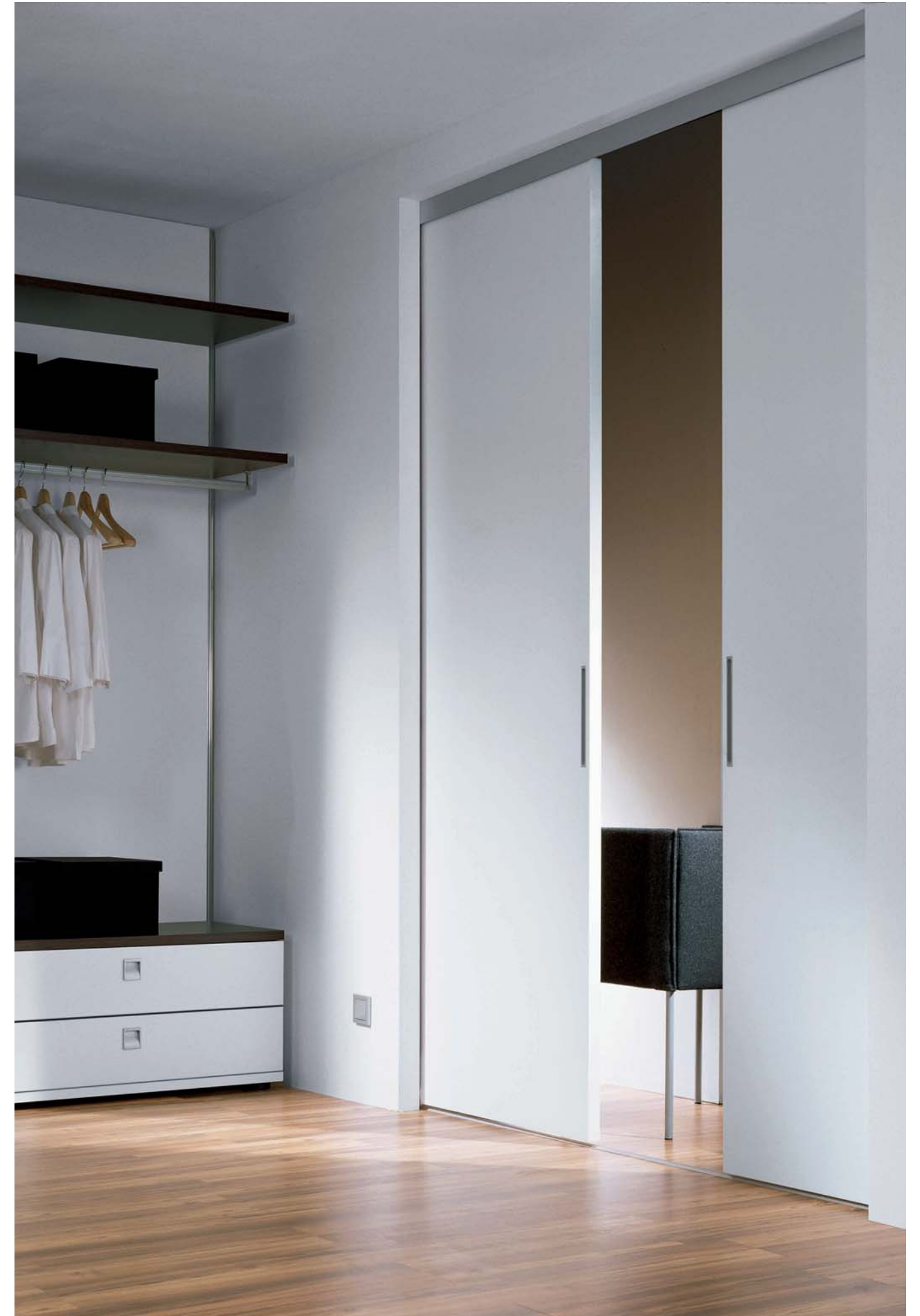
Left: SINUS full-face door – no profile. Uni pure white semi-matt finish, built-in recessed handle and anodised aluminium. Runner technology: floor track, two-way, recessed Right: SINUS full-face door – no profile. Uni pure white semi-matt finish, built-in recessed handle and anodised aluminium. Runner technology: floor track, one-way, fitted.