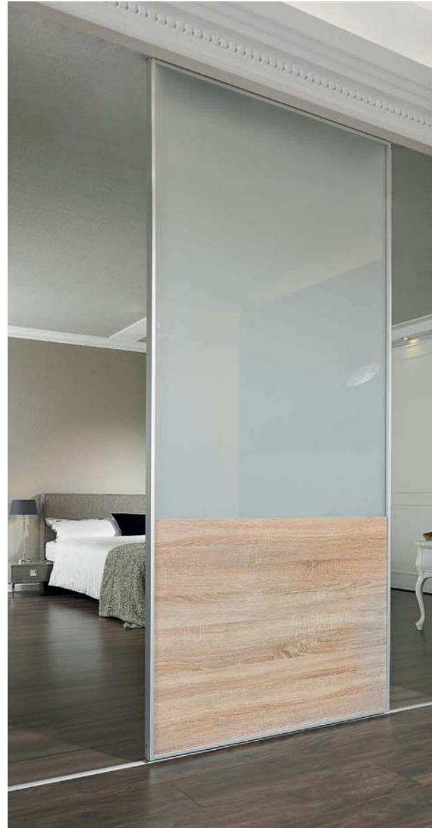
S-Linie, Türform „U“, Füllung: VSG mit hellmatter Folie und Eiche hell SINUS S range, „U“ door, safety-glass panel with light-matt film and pale oak finish.