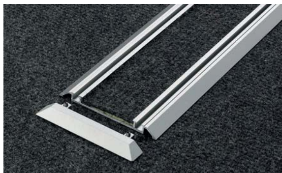
Bodenschiene aufgesetzt mit flachem Mittelsteg für Teppich, 2-läufig Fitted floor track, with flat centre bar for carpet, two-way