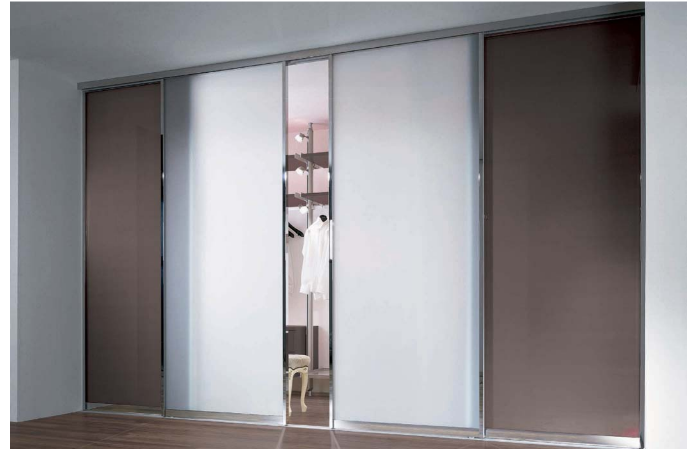
SINUS Profil I, glänzend verchromt, Füllung: VSG mit hellmatter Folie, Parsolspiegel. Lauftechnik: Aufgesetzte Bodenschiene, 2-läufig. Sinus profile I, high-gloss, chrome-plated, panel: Safety glass with light-matt film, parsol glass. Runner technology: floor track, two-way, fitted.