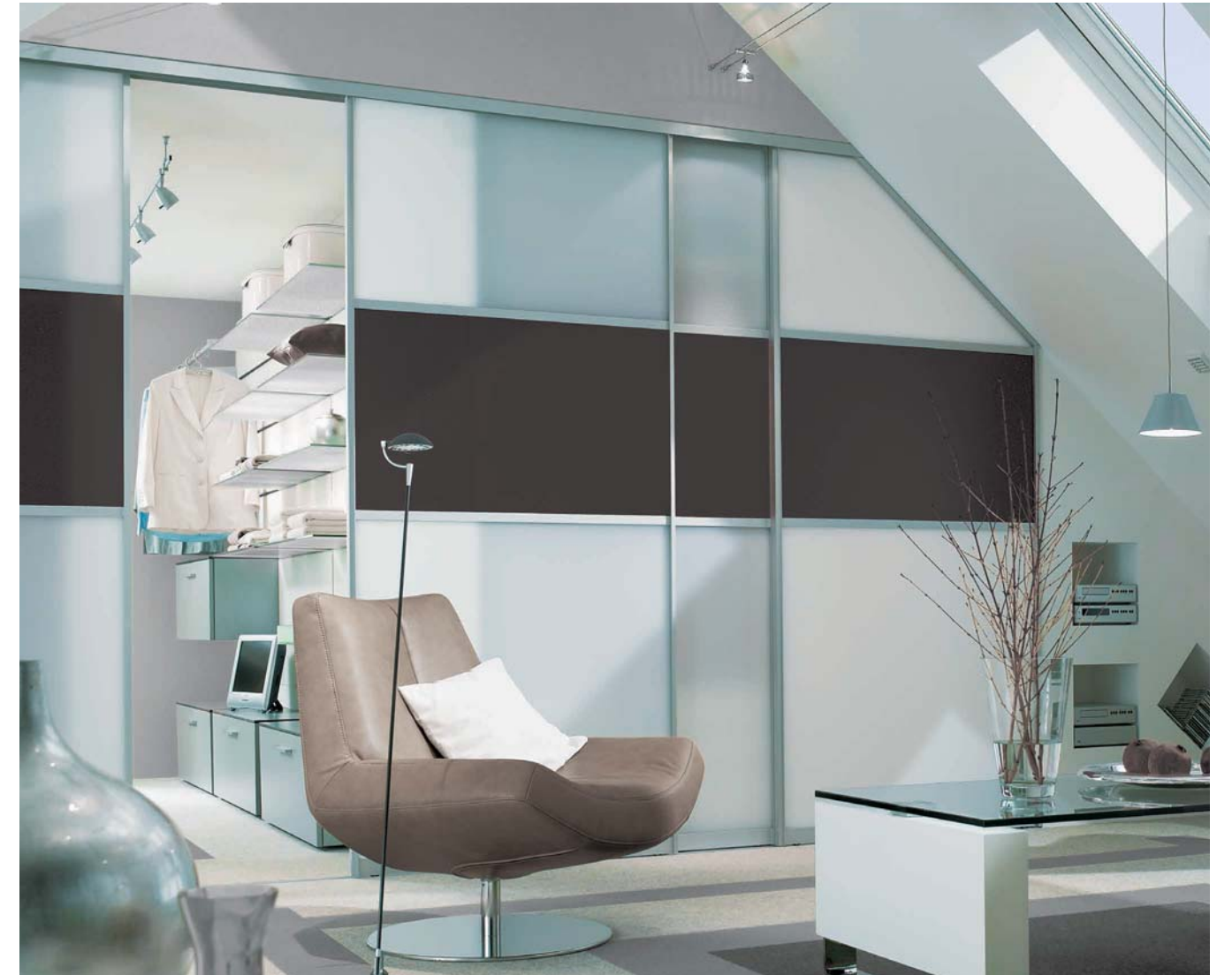
SINUS Profil I und III mit füllungsteilenden Querprofilen, Alu eloxiert, Füllung: VSG mit hellmatter Folie, mittig Lacobel brown natural. Lauftechnik: Aufgesetzte Bodenschiene, 2-läufig.

SINUS Profile I, anodised aluminium, panel: Oriental brown finish and crystal mirrors Runner technology: floor track, two-way, fitted.