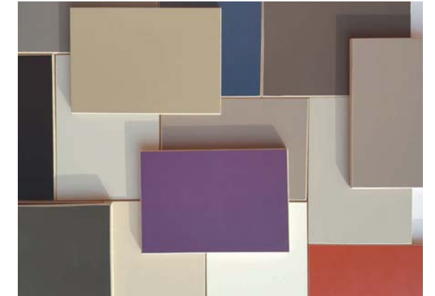
Lack in Standardfarben Lacquered in standard colours