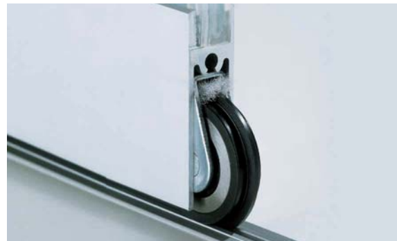
Untere Laufrolle der stehenden Tür mit Reinigungsbürste Lower roller, standing door with cleaning brush