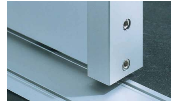
Profil I, Alu eloxiert Profile I, anodised aluminium