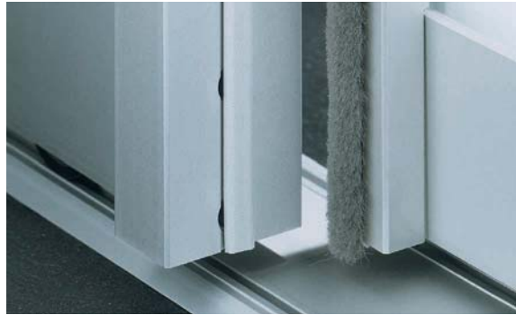
Eingenutete Anschlagdichtung und Staubbürste Embedded with seal and dust brush strip