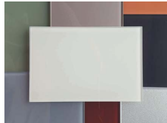
Lacobel-Gläser Lacobel glass