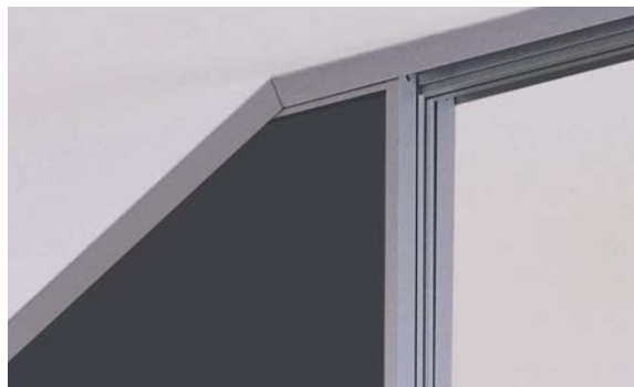
Seitlich abgeschrägte Tür mit Führung in der Deckenschiene Door sloping sideways, operated by ceiling track