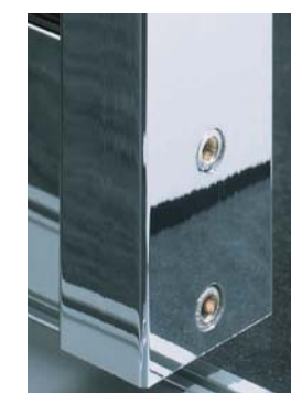
Chrom Chrome (möglich bei Profil I+II) (available for profiles I and II)

SINUS offers six different profile varieties as well as a full-face sliding door without profile (see pages 16-19). The handles are finished with anodised aluminium as standard. There are also another three different finishes to choose from: