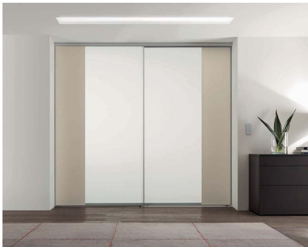
Links: SINUS S-Linie, Türform „L“ und „R“, Füllung VSG mit hellmatter Folie und sandbeige lackierter Oberfläche. Lauftechnik: Aufgesetzte Bodenschiene, 2-läufig. Rechts: SINUS S-Linie, Türform „U“, Füllung VSG mit hellmatter Folie und Nussbaum dunkel. Lauftechnik: Aufgesetzte Bodenschiene, 2-läufig.