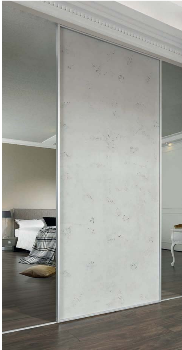
S-Linie, Füllung: Betonoptik S range, panel: Stone look