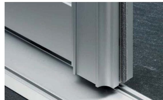
Profil IV, Alu eloxiert mit Bürstenanschlagsdichtung Profile IV, anodised aluminium with brush draught excluder